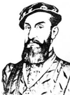
Cabeza de Vaca