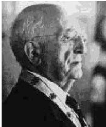
Salvador de Madariaga

mente lo más esencial de esa cultura es don Quijote. ¿Pero qué es “lo más esencial” de esa cultura? ¿Cuál es aquel valor que, de faltar, reduciría a la nada todo lo demás? Para Madariaga la respuesta es evidente: ese valor es la libertad. Nada de extraño tiene, por lo tanto, que termine su Guía del Lector del “Quijote” con lo que considera la sentencia más genuinamente europea del caballero: “La libertad, Sancho, es uno de los más preciados dones que a los hombres dieron los cielos; con ella no pueden igualarse los tesoros que encierra la tierra ni el mar encubre; por la libertad, así como por la honra, se puede y debe aventurar la vida”.