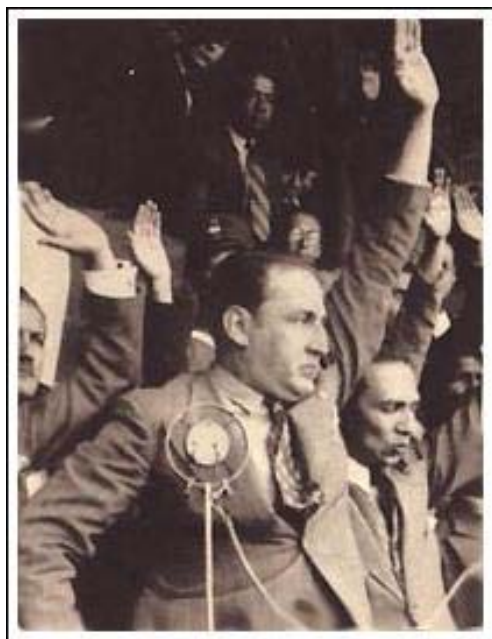
Víctor Raúl Haya de la Torre

En definitiva un libro que presenta una notable investigación en su campo y a la vez un testimonio histórico de primera mano, que desde ahora será imprescindible para clasificar la obra y la personalidad del fundador del aprismo.