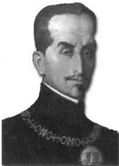
El Inca Garcilaso de la Vega

por Wu Shoulin en su Historia concisa de la literatura latinoamericana . La Editora Comercial, la más antigua y prestigiosa en China, ha decidido publicar la traducción de la Primera Parte de los Comentarios Reales . Estoy convencido de que, con el correr del tiempo, irá en aumento el número de chinos que lo conozcan y se interesen por él.