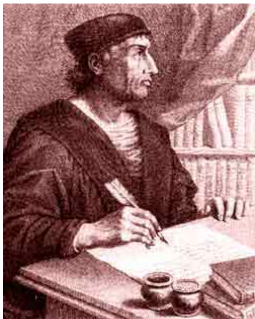
Elio Antonio de Nebrija